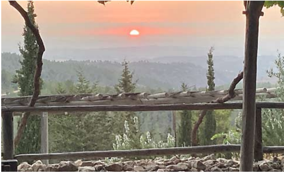
Näkymä Jad Hashmonasta kohti rannikkotasankoa.

Jad Hashmona on Israelissa, Juudean vuorilla sijaitseva asutus, moshav shitufi , noin 15 km Jerusalemissa Tel Aviviin.