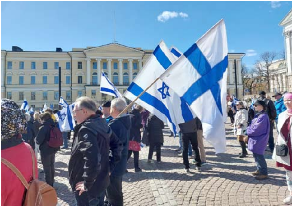
Toukokuun 5. päivä Helsingissä marssittiin sinivalkeisin värein Israelin puolesta ja antisemitismii vastaan.

kaikki korvat olivat liimaantuneet radioihin vuonna 1948 kuuntelemaan häntä.